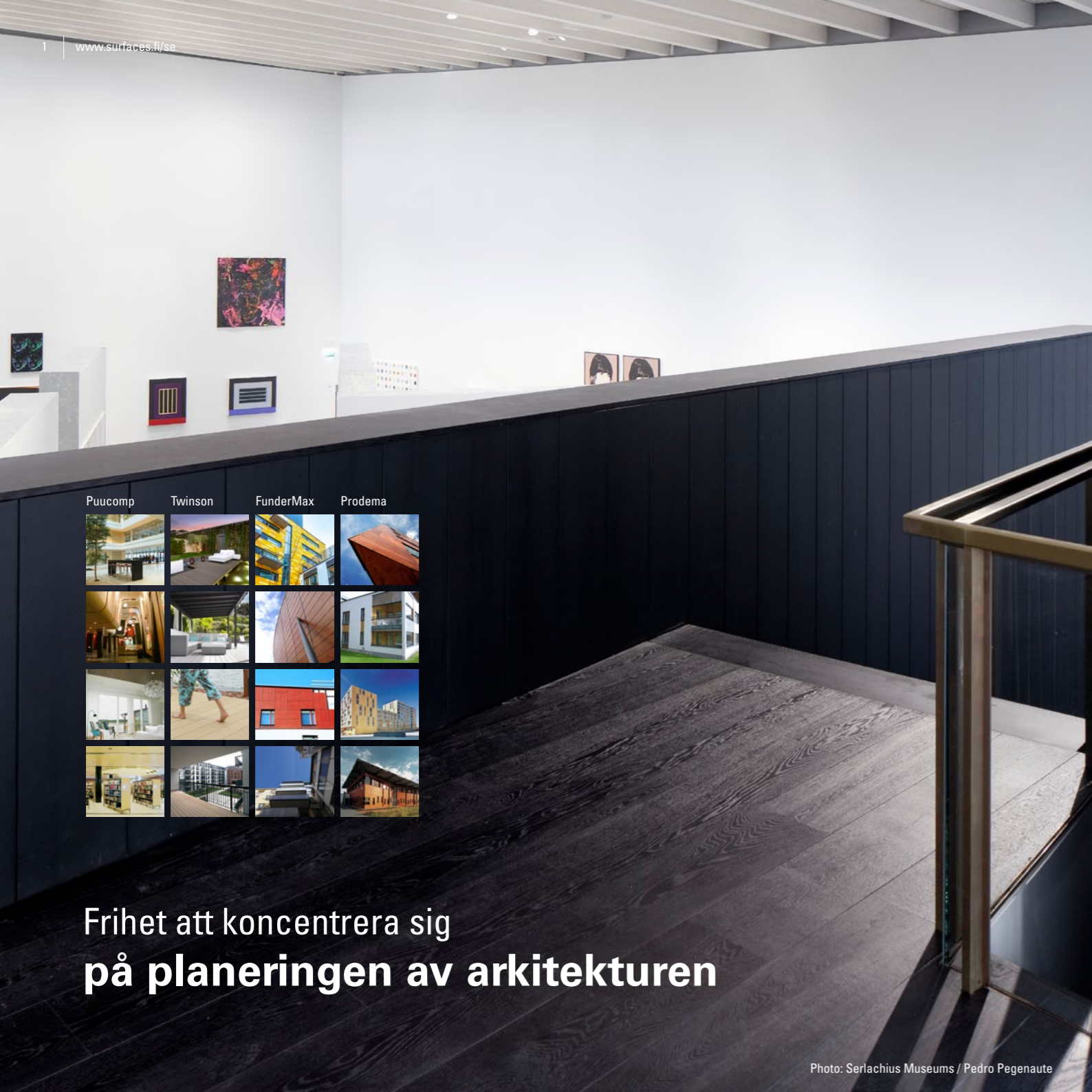
Puucomp Twinson FunderMax Prodema